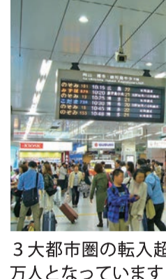
3大都市圏の転入超過数は、全体で約12万人となつています

読み取れます。 『TDB景気動向調査(全国)』 1月の景気DIは8カ月ぶりに悪化