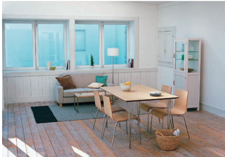
春のシーズン真っ只中の賃貸市場は、好調をキープする一方、活況な取引の中でも、安定した持続可能な賃貸経営の構築が望まれています

要都市の「賃貸マンション・アパート」募集家賃動向(2025年12月)を見ると、マンションの平均募集家賃は、首都圏全エリアのほか、名古屋市、京都市など計10エリアが全面積帯で前年同月を上回っています。